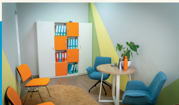
Cabinetul psihologului școlar