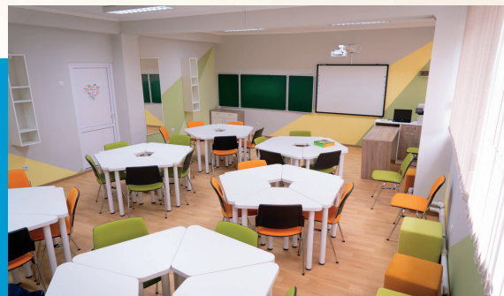
Clasă de studii